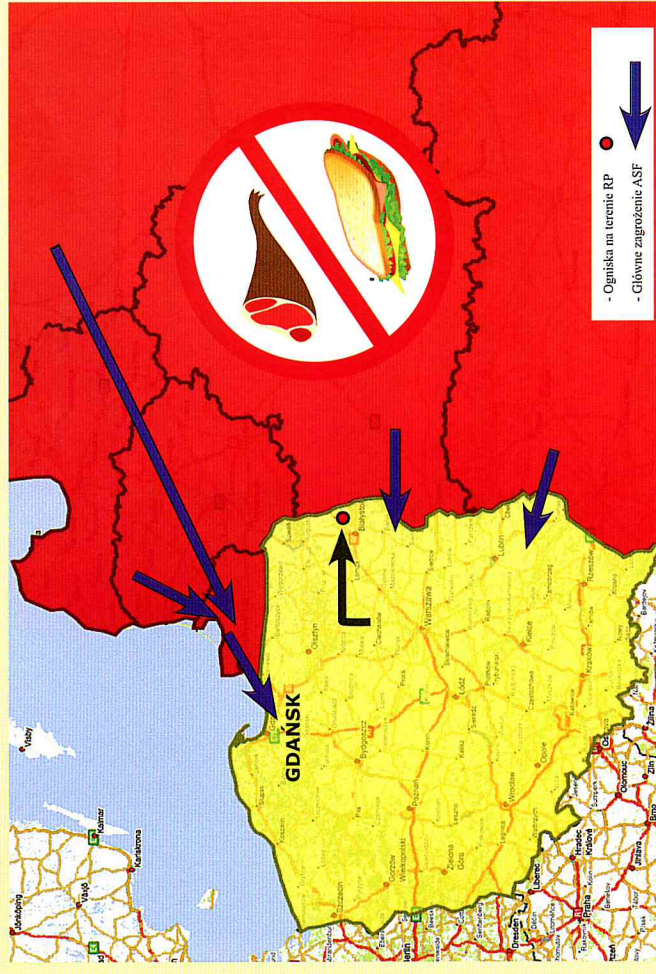
Schemat nr 1.

AFRYKAŃSKI POMÓR ŚWIŃ (ASF) w szybkim tempie dotarł do naszych granic, występuje w państwach graniczących od wschodu z Polską, a także na terenie naszego kraju. Stwierdzono występowanie tej choroby, nie tylko u dzików, ale także u trzody chlewnej. Dodatkowo służby sanitarne Federacji Rosyjskiej podały informacje o stwierdzeniu wirusa w środkach spożywczych pochodzących od świń, wyprodukowanych przez jednego z największych producentów mięsnych działających na terenie Rosji.